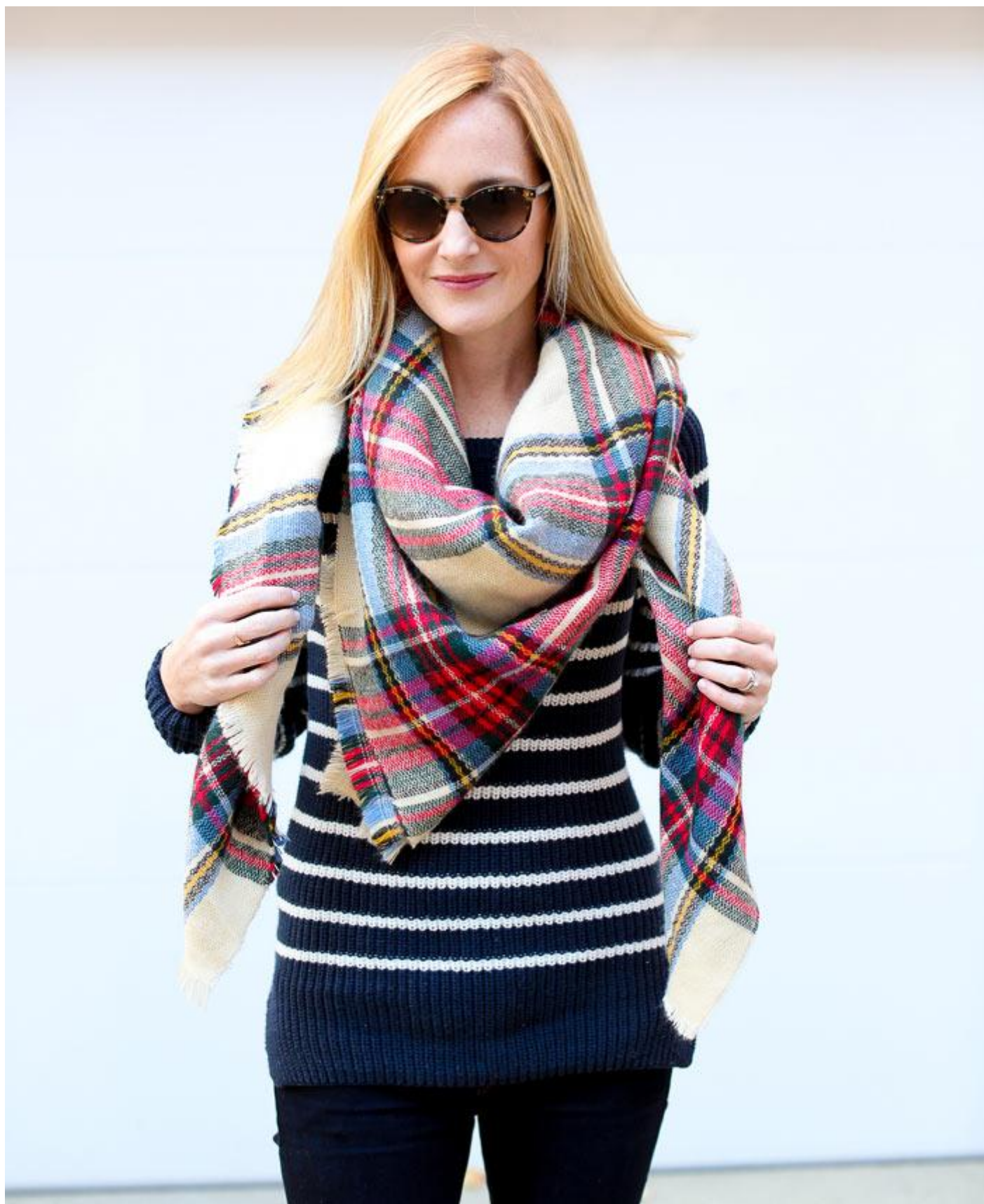
همانند روش های قبلی ابتدا آن را به شکل مثلث تا کرده به دور گردن انداخته و دور گردن ببچانید