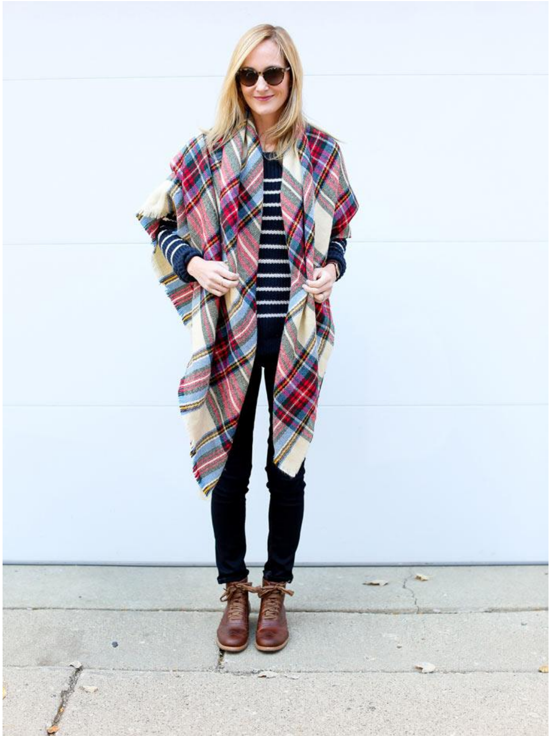
سپس آن را روی شانه هایتان بیندازید.