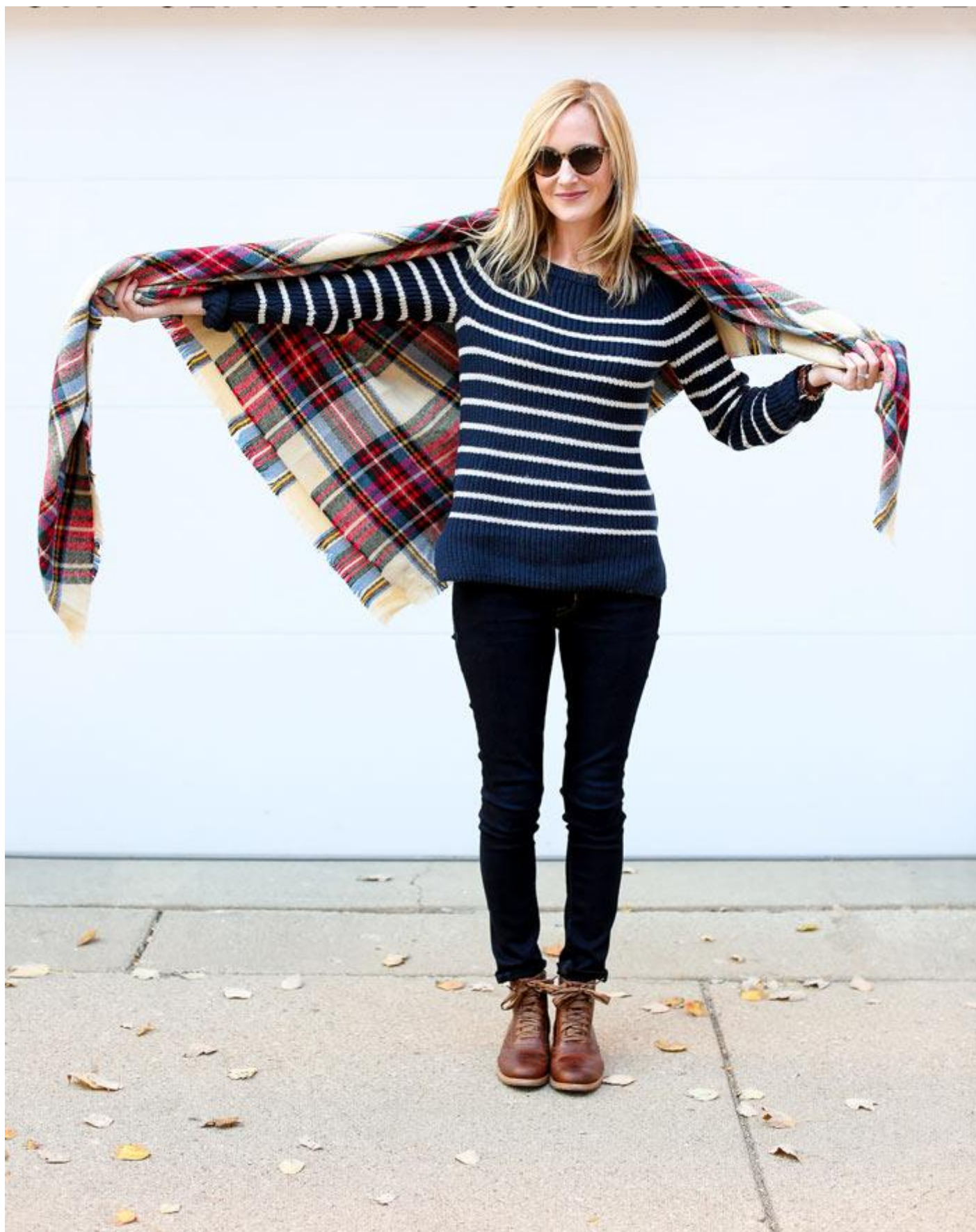
در این مدل ابتدا در خارج از مرکز شال قرار بگیرید