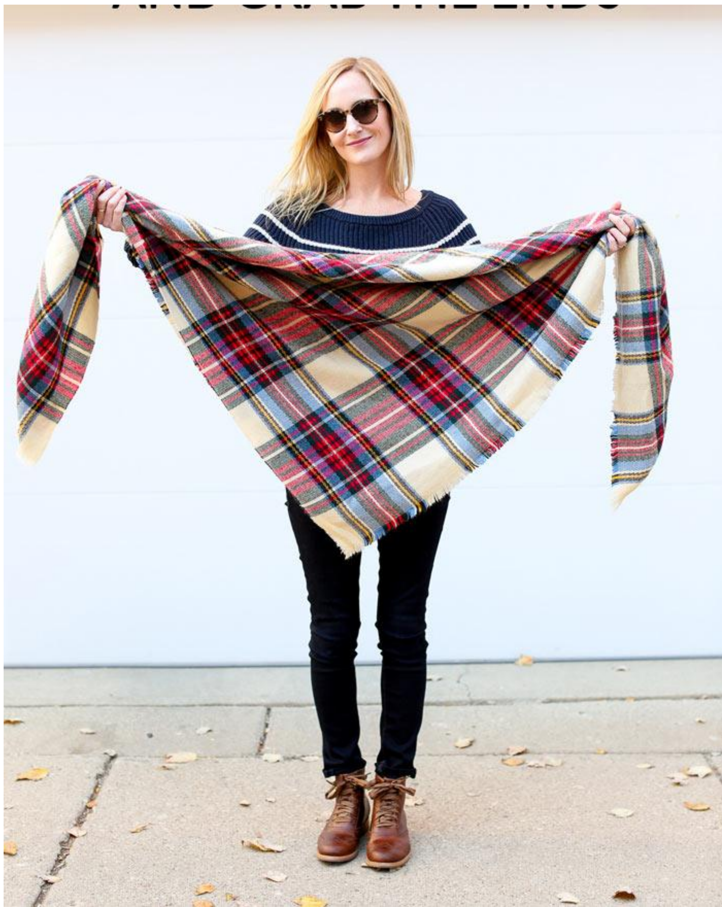
شال را به شکل مثلث تا کرده و دو طرف انتهایی آن را بگیرید