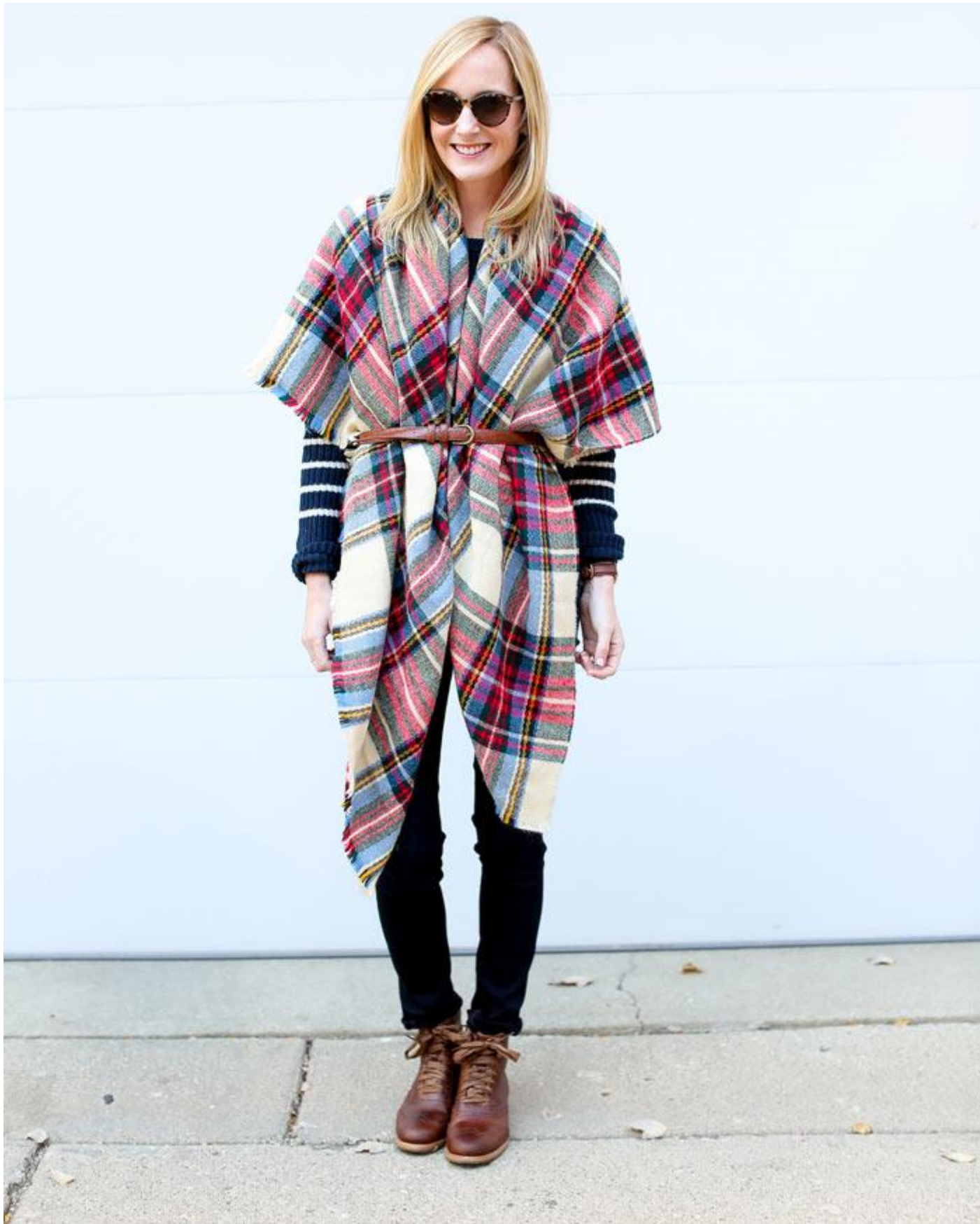
مدل تک گره ای ۲,