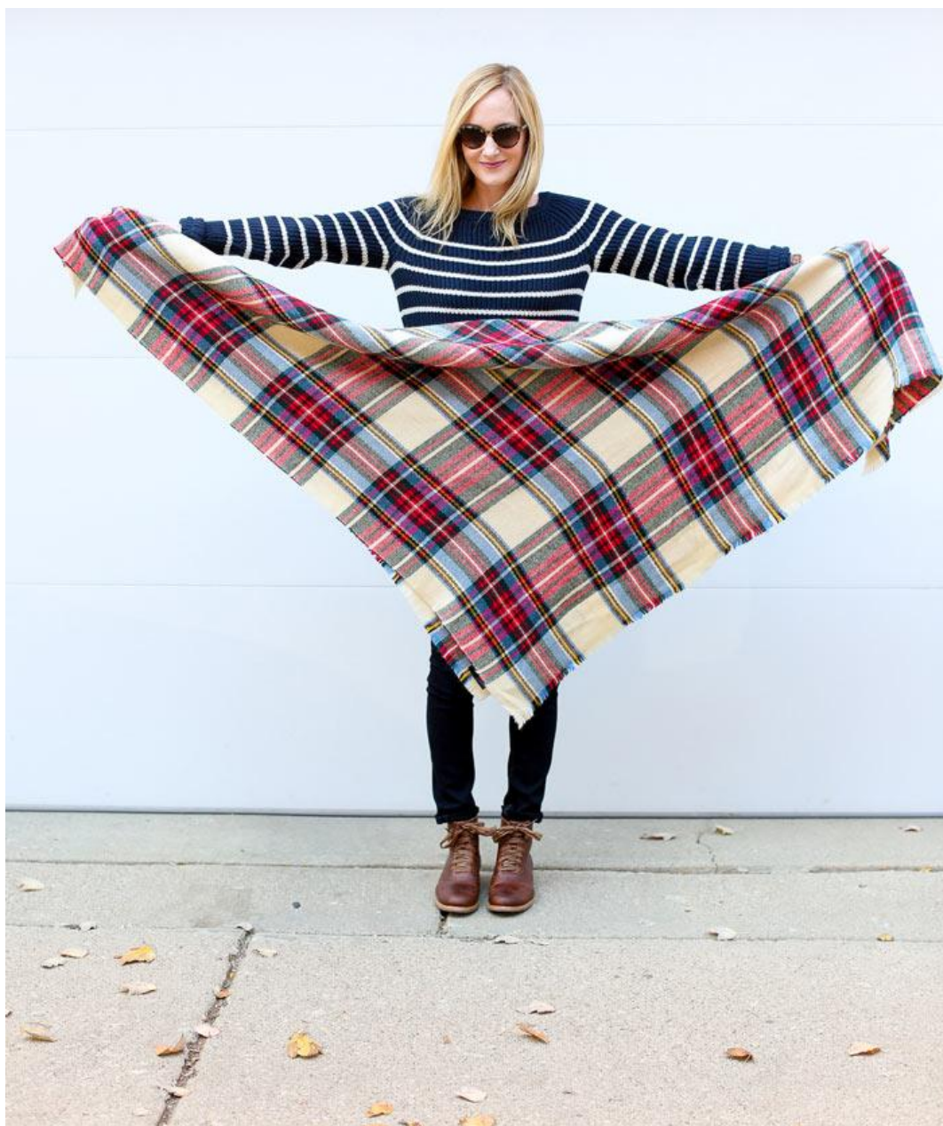
ابتدا شال را به شکل مثلث تا کنید.